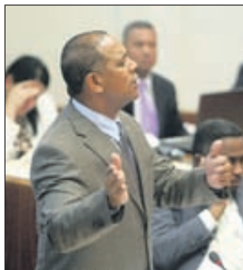
Minister di Infraestructura, Integracion y Medio Ambiente, Benny Sevinger.

ORANJESTAD – Diamars ultimo Minister di Infraestructura, Integracion y Medio Ambiente Benny Sevinger tabata den Parlamento relaciona cu e presupuesto di WIF y DOW. Aunke cu e presupuesto a wordo aproba caba, e presencia di e mandatario den Parla-